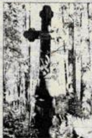
п. Квиток, поселковское кладбище

ских захоронений на кладбище в поселке Кавток. Надо сказать, что такие захоронения уже превратились в ламповики истории и культуры. А их, как мы знаем, надо сохранять. Хотя бы в нашей памяти и на бумаге.