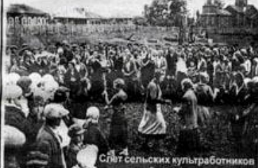
Слет сельских культуротников

новские, Пожарный, Волостной, Заводской, Жичанский).