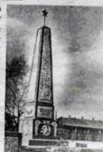
Памятник Шиткинским партизанам в середине 70-х годов

Вспомнилось страшно возмущенное выступление "Бирюсинской нови" по случаю варварского поступка каких-то подростков (?) к памятнику И. А. Бичу-Таженому. Да, это был возмутительный случай. Но подростков (может, и не они все?) в некоторой степени оправдывает то, что нет никакой связи между ними и указанным памятником. А вот состояние памятника в парке, могилы