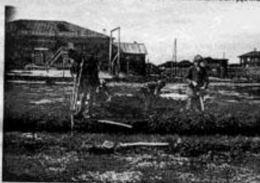
На строительстве первого памятника