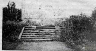
Так выглядит памятник Шиткинским партизанам сегодня

того же И. А. Бича-Таженого там же, действительно во сто крат возмутительнее. Живут в Тайшете те, кто инициировал его возведение, и те, кто возводил. Сидят в своих должностных креслах столоничальники, обязанные охранять, беречь, содержать памятники истории и культуры, архитектуры, в том числе, нашего города... Невосполнение ими своих обязанностей, отказ от своих же инициатив, оборачивающихся разрушением памятников - более варварский поступок, чем тот, что совершили подростки. Но это не вызывает в наших сердцах и умах праведного гнева и обоснованного возмущения. Странные мы все люди. Как и вся история наша. Былым правителям при жизни в ножи кланялись, а по уходу кланем на чем свет стоит, то есть по-русски. А может и памятники у нас в России, как правители, воздвигаются для того, чтобы их немного погодя низвергать?