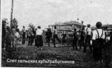
Слет сельских культуротников

На втором этапе застройки Тайшета (1897-1914 гг.) постепенно оформился культурный, деловой, торго-