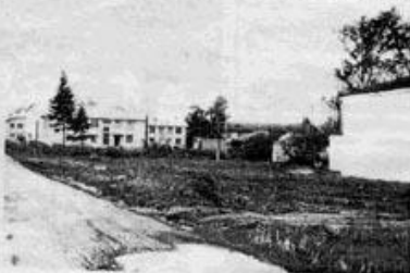
Бывший центр Тайшета сегодня

советское время он стал еще более значимым, обустроенным. Вот на фотографии запечатлен слет сельских культуротников 1935 года. Обратите внимание на территорию, где протекают события, запечат-